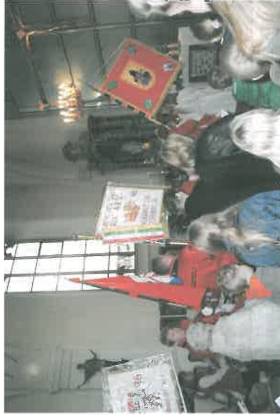
Einzug zum Gottesdienst