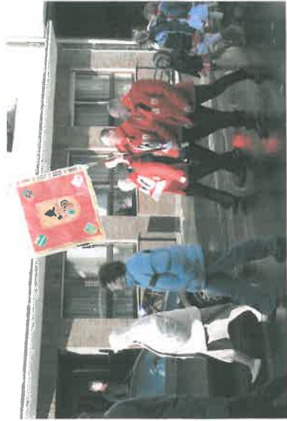
Abmarsch zum Vereinshaus der St.-Kunibertus Schützengesellschaft